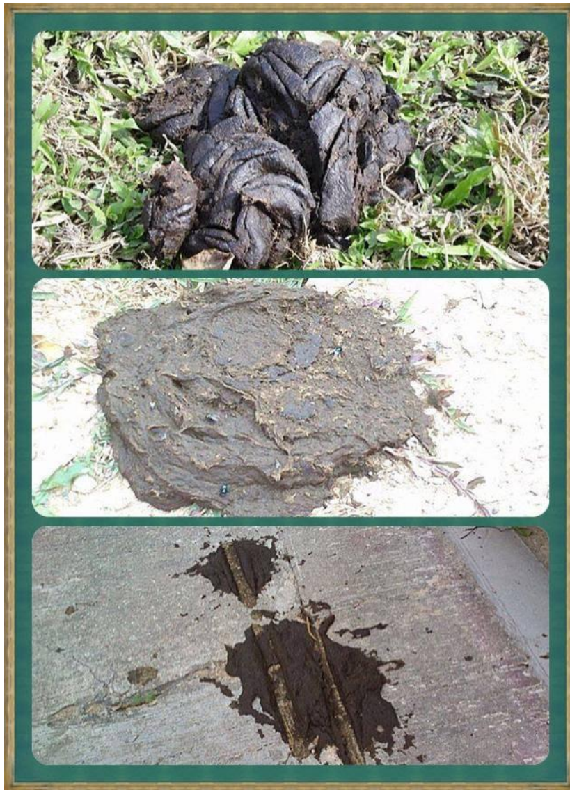
圖一：這是一篤最健康的層層塔式牛屎